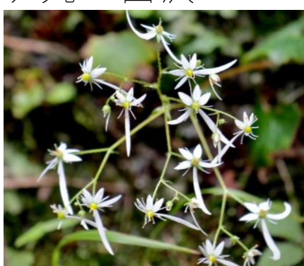
ダイヤモンドジソウ