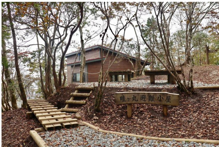
建替え工事が完了した 畦ヶ丸避難小屋