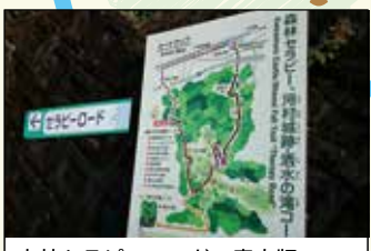
森林セラピーロードの案内版

山北町健康福祉センター さくらの湯 山北駅に隣接する便利な場所にある入浴施設。炭酸カルシウムが湯にとけ込んでいます。打たせ湯・圧注浴・サウナなどもあり、美肌づくりやリフレッシュなどに。 【住】足柄上郡 山北町山北1971-2 【電】0465-75-0819 【営】10:30～21:00 【入】大人400円(2時間)、700円(6時間) 小中学生200円(2時間)、350円(6時間) 【休】木ほか 【HP】 http://www.town.yamakita.kanagawa.jp