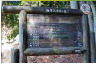
5 西丹沢県民の森 広大な「西丹沢県民の森」の案内図。気の向くままに散策してみてください。